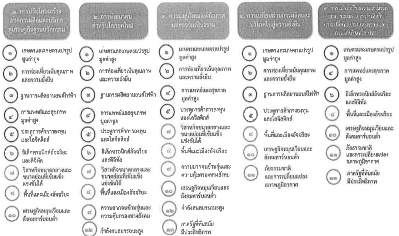
แผนภาพที่ ๓.๑ ความเชื่อมโยงระหว่างหมวดหมู่การพัฒนากับเป้าหมายหลัก

ความเชื่อมโยงระหว่างหมวดหมู่การพัฒนากับเป้าหมายหลักแสดงไว้ในแผนภาพที่ ๓.๑ โดยหมวดหมู่ การพัฒนาที่กำหนดขึ้นเป็นประเด็นที่มีลักษณะเชิงบูรณาการที่ครอบคลุมการพัฒนาตั้งแต่ในระดับต้นน้ำจนถึง ปลายน้ำ และสามารถนำไปสู่ผลพัฒนาทั้งในมิติเศรษฐกิจ สังคม ทรัพยากรธรรมชาติและสิ่งแวดล้อมไปพร้อมๆ กัน ทำให้หมวดหมู่แต่ละประการสามารถสนับสนุนเป้าหมายหลักได้มากกว่าหนึ่งข้อ นอกจากนี้การพัฒนาภายใต้ แต่ละหมวดหมู่ไม่ได้แยกขาดจากกัน แต่มีการสนับสนุนหรือเอื้อประโยชน์ซึ่งกันและกัน